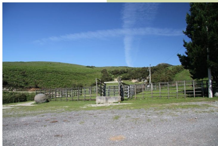
Curro de San Tomé de Recaré