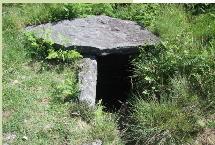
Dolme de San Tomé de Recaré