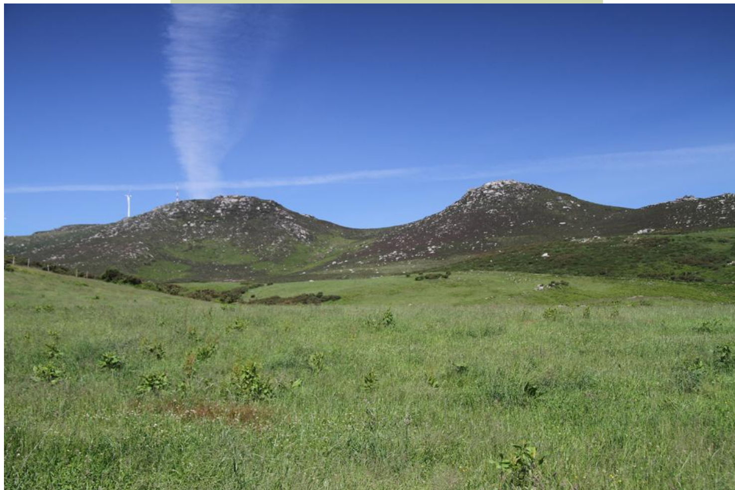
Os Penidos desde o Prado das Chantas