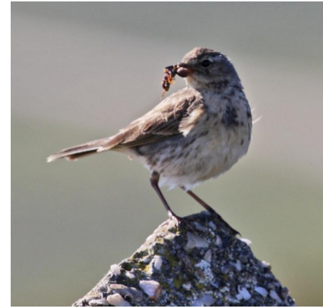
Pica da árbores ( Anthus trivialis ), un paxaro de espazos abertos que aniña no chan.

Unha viaxe ata o Xistral do Valadouro para gozar dos amplos espazos abertos e fermosas panorámicas que abranguen, nos 360º, toda a serra do Xistral, os montes de Montemaior e o Buiro, o Valadouro, a Frouxeira e puntos da costa do Cantábrico, e a serra da Toxiza; ao que hai que engadir aspectos histórico-culturais e lendarios como o dolme ou arca do Padorno, ao pé do curro de San Tomé, e o Prado das Chantas, un espazo circular rodeado en case todo o seu perímetro de pedras fincadas de ata 1 m de altura, no que está en discusión se son os restos dun vello curro ou un dos poucos círculos líticos que se conservan en Galiza, e camiñar, entre breixos, polos carreiros do gando, ata o cumo do Penido.